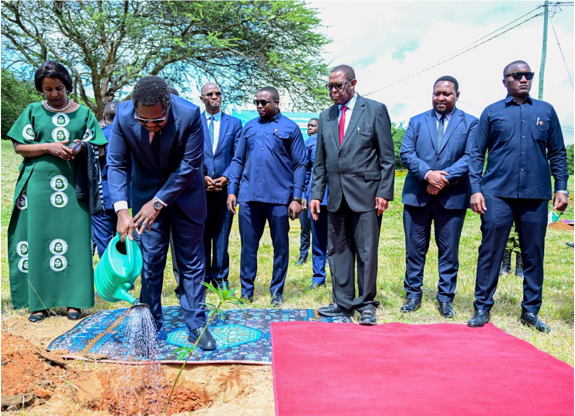
Makamu wa Rais wa Jamhuri ya Muungano wa Tanzania Mhe. Balozi Dkt. Emmanuel Nchimbi akimwagilia mti aina ya mwembe aliopanda wakati alipowasili katika Ukumbi wa Chimwaga jijini Dodoma, kwa ajili ya ufunguzi wa Kongamano la Vijana katika Kumbukizi ya Miaka 104 ya Kuzaliwa Baba wa Taifa, Hayati Mwalimu Julius Kambarage Nyerere Aprili 11, 2026.

81. Mheshimiwa Spika, pamoja na kampeni hii, Ofisi ya Makamu wa Rais kwa kushirikiana na Jiji la Dodoma imeendelea kuhamasisha wadau mbalimbali kujihusisha na suala la kukijanisha Jiji la Dodoma. Hadi Machi, 2026 jumla ya miti 960,210 imepandwa katika maeneo mbalimbali ya Jiji na iliyostawi ni miti 787,372 sawa na asilimia 82. Aidha, Ofisi itaendelea kushirikiana na wadau mbalimbali kuhakikisha kuwa zoezi la upandaji miti katika maeneo mbalimbali ya Jiji la Dodoma linakuwa endelevu kwa ajili ya kupambana