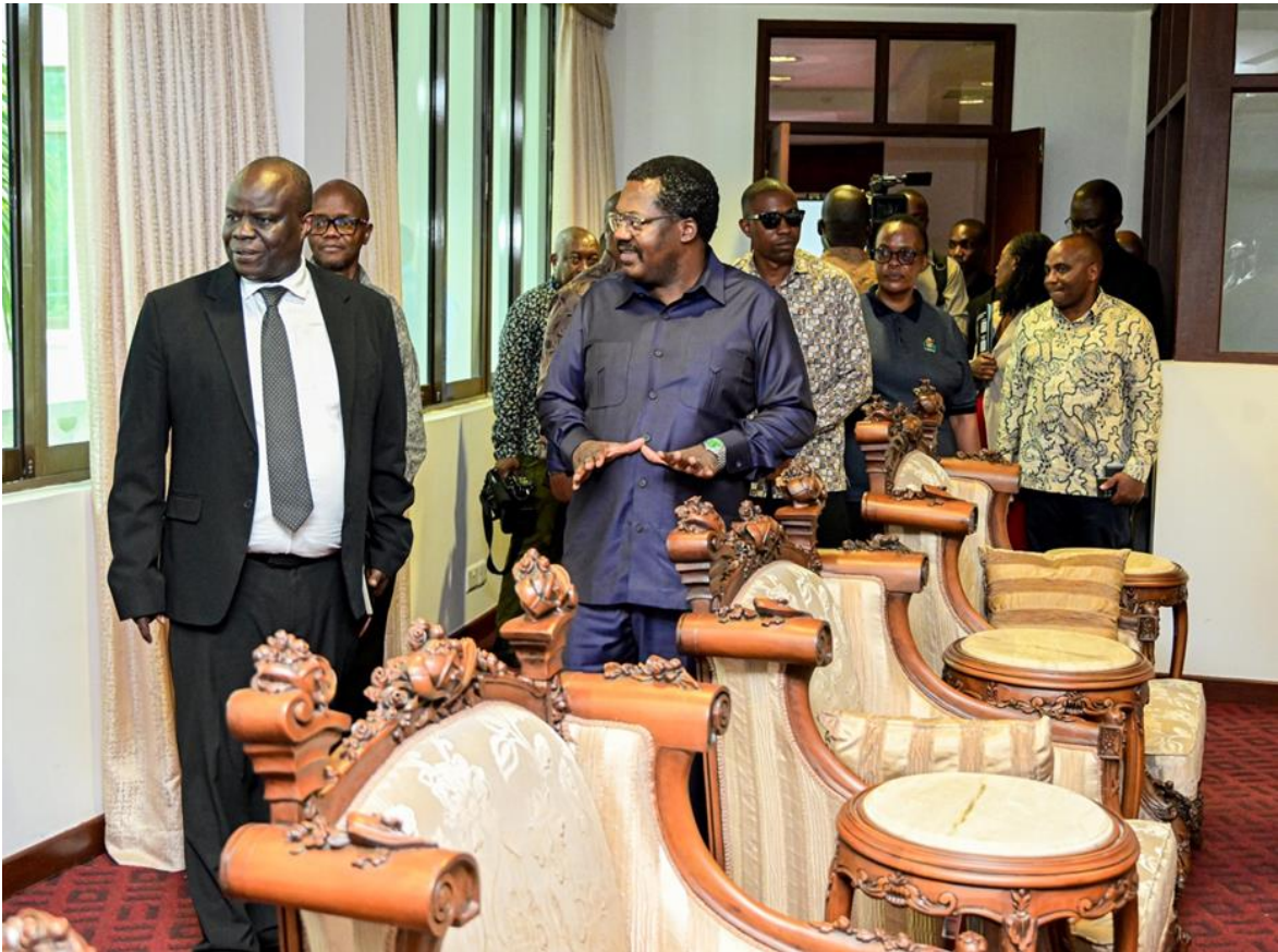
Makamu wa Rais wa Jamhuri ya Muungano wa Tanzania Mhe. Balozi Dkt. Emmanuel Nchimbi akikagua ukarabati wa Jengo la Ofisi ya Makamu wa Rais iliyopo Mtaa wa Luthuli, Posta Jijini Dar es Salaam Januari 29, 2026.