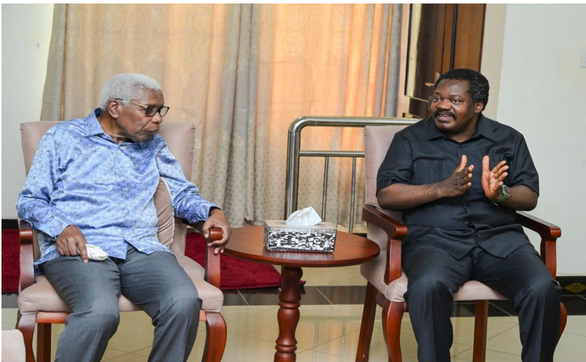
Makamu wa Rais wa Jamhuri ya Muungano wa Tanzania Mhe. Balozi Dkt. Emmanuel Nchimbi, alipomtembelea Makamu wa Rais Mstaafu wa Jamhuri ya Muungano wa Tanzania Mhe. Dkt. Mohamed Gharib Bilal, katika makazi yake Masaki Jijini Dar es Salaam, Januari 02, 2026.