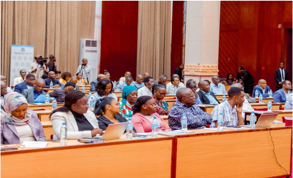
Wahariri wa Vyombo vya Habari mbalimbali wakishiriki Semina ya kujenga uelewa kuhusu Muungano iliyofanyika jijini Dar es Salaam Desemba 23, 2025.

tarehe 19 Desemba, 2025 na Dar es Salaam tarehe 23 Desemba, 2025.