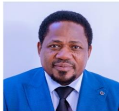
Mhe. Reuben Nhamanilo Kwagilwa (Mb.) Naibu Waziri (Muungano na Mazingira)