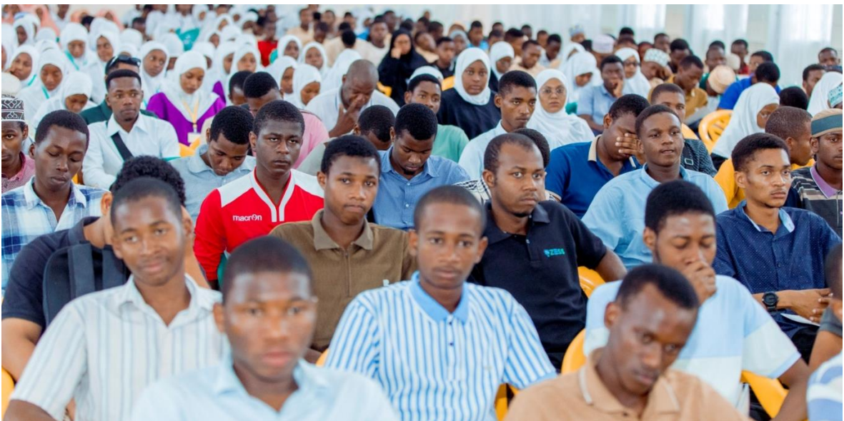
Wanafunzi wa Vyuo vya Elimu ya Juu Zanzibar wakishiriki Kongamano kuhusu Muungano lililofanyika katika Mkoa wa Kusini, Unguja Februari 19, 2026.

32. Mheshimiwa Spika, Vilevile Ofisi iliandaa na kuratibu Makongamano kuhusu masuala ya Muungano kwa Wanafunzi wa Vyuo vya Elimu ya juu wa Vyuo vilivyopo Zanzibar lililofanyika tarehe 19 Februari, 2026 katika Ukumbi wa Chuo Kikuu cha Taifa cha Zanzibar.