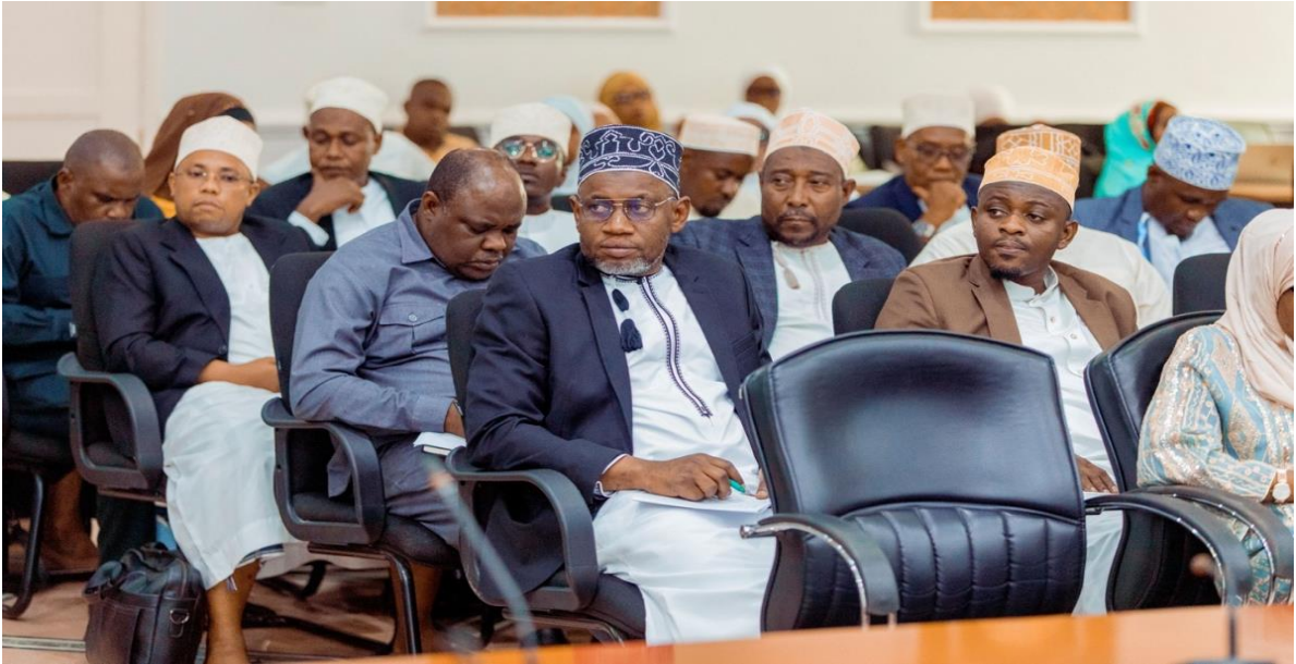
Sehemu ya Wajumbe wa Baraza la Wawakilishi Zanzibar wakishiriki Semina kuhusu Muungano iliyofanyika Unguja, Zanzibar, Februari 27, 2026

32. Mheshimiwa Spika, Vilevile Ofisi iliandaa na kuratibu Makongamano kuhusu masuala ya Muungano kwa Wanafunzi wa Vyuo vya Elimu ya juu wa Vyuo vilivyopo Zanzibar lililofanyika tarehe 19 Februari, 2026 katika Ukumbi wa Chuo Kikuu cha Taifa cha Zanzibar.