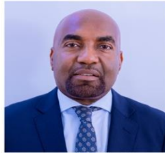
Mhe. Mhandisi. Hamad Yussuf Masauni (Mb.) Waziri wa Nchi (Muungano na Mazingira)