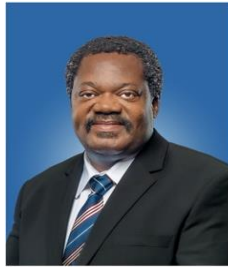
Mhe. Balozi. Dkt. Emmanuel John Nchimbi Makamu wa Rais wa Jamhuri ya Muungano wa Tanzania