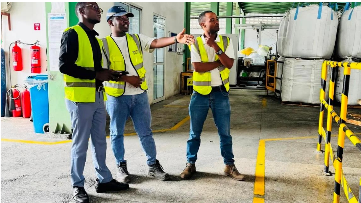
Wataalam wa Baraza la Taifa la Hifadhi na Usimamizi wa Mazingira (NEMC) Kanda ya Ilala jijini Dar es Salaam, Februari 25, 2026 wakifanya ukaguzi wa mazingira pamoja na kutoa elimu ya Uzingatiaji wa Sheria ya Usimamizi wa Mazingira viwandani.

uzingatiaji, uwekaji mifumo thabiti ya kuhifadhi taka ngumu, kuboresha mifumo ya kutibu majitaka na udhibiti wa hewa chafu. Hata hivyo, miradi 137 sawa na 4% ya miradi iliyokaguliwa ilibainika kutozingatia sheria na hivyo wahasika walichukuliwa hatua stahiki za kisheria. Kutokana na kaguzi hizo, kumekuwa na ongezeko la wawekezaji wanaojisajili kwa ajili ya Tathmini ya Athari kwa Mazingira (TAM) na kaguzi za mazingira kutokana na uhamasishaji na ufuatiliaji unaofanyika.