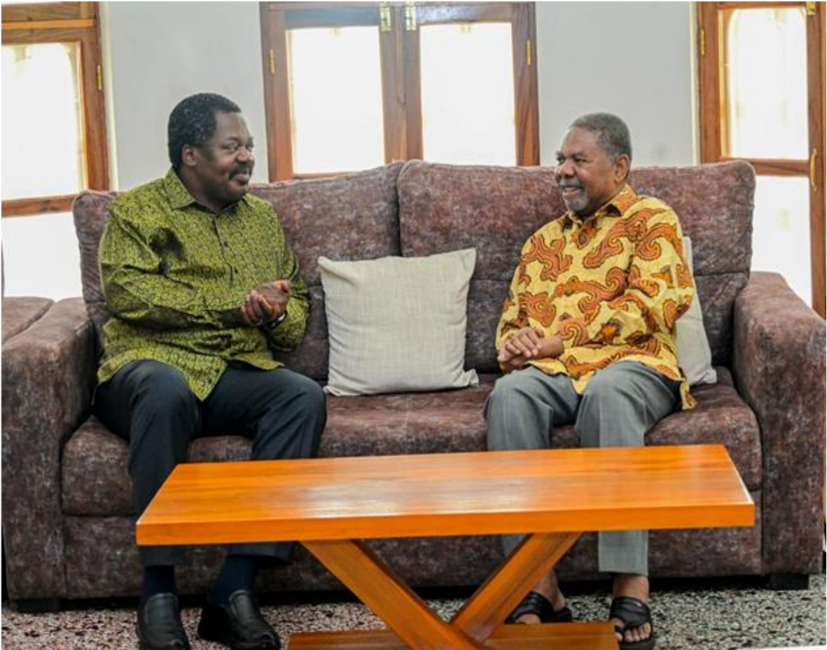
Makamu wa Rais wa Jamhuri ya Muungano wa Tanzania Mhe. Balozi Dkt. Emmanuel Nchimbi, alipomtembelea Mhe. Dkt. Ali Mohamed Shein, Makamu wa Rais Mstaafu wa Jamhuri ya Muungano wa Tanzania na Rais Mstaafu wa Zanzibar katika makazi yake Unguja, Zanzibar, Januari 03, 2026.