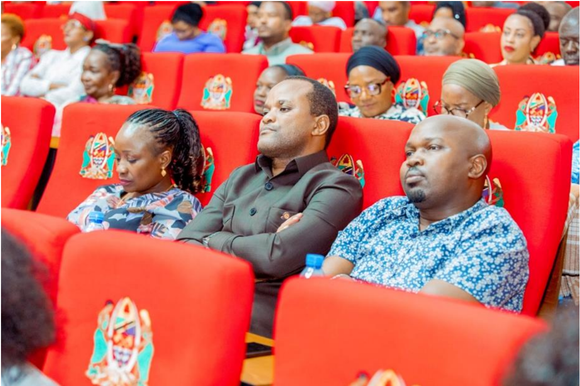
Sehemu ya Wabunge wa Bunge la Jamhuri ya Muungano wa Tanzania wakishiriki Semina ya kujenga uelewa kuhusu Muungano iliyofanyika jijini Dodoma Februari 11, 2026.

31. Mheshimiwa Spika , Aidha, Ofisi ilitoa Semina kuhusu masuala ya Muungano kwa Waheshimiwa Wabunge wa Bunge la Jamhuri ya Muungano wa Tanzania katika Ukumbi wa Pius - Msekwa Jijini Dodoma tarehe 11 Februari, 2026 na tarehe 27 Februari, 2026 kwa Waheshimiwa Wajumbe wa Baraza la Wawakilishi, katika Ukumbi wa Mikutano wa Baraza la Wawakilishi, Zanzibar.