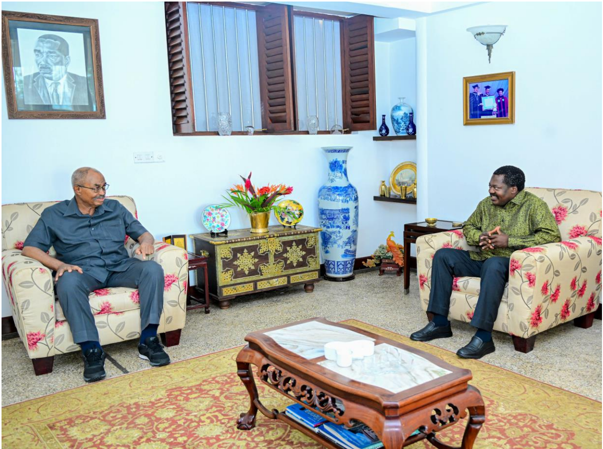
Makamu wa Rais wa Jamhuri ya Muungano wa Tanzania Mhe. Balozi Dkt. Emmanuel Nchimbi akizungumza na Rais Mstaafu wa Serikali ya Mapinduzi ya Zanzibar Mhe. Dkt. Amani Abeid Karume alipomtembelea katika makazi yake Unguja, Zanzibar Januari 03, 2026.