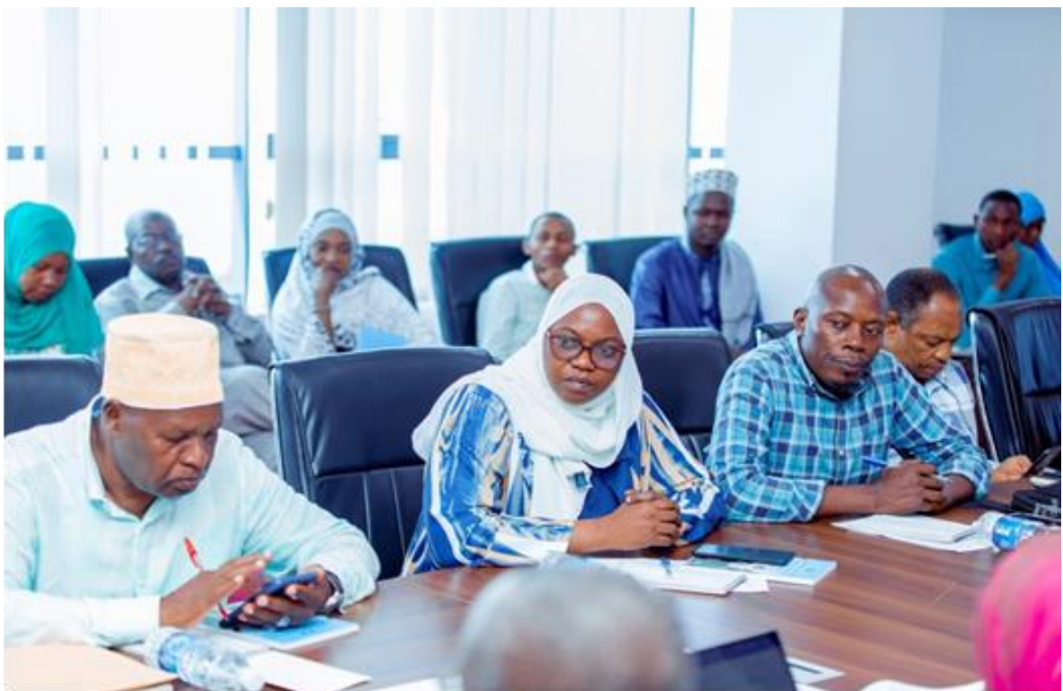
Wahariri wa Vyombo vya Habari mbalimbali wakishiriki Semina ya kujenga uelewa kuhusu Muungano iliyofanyika Zanzibar Desemba 19, 2025.